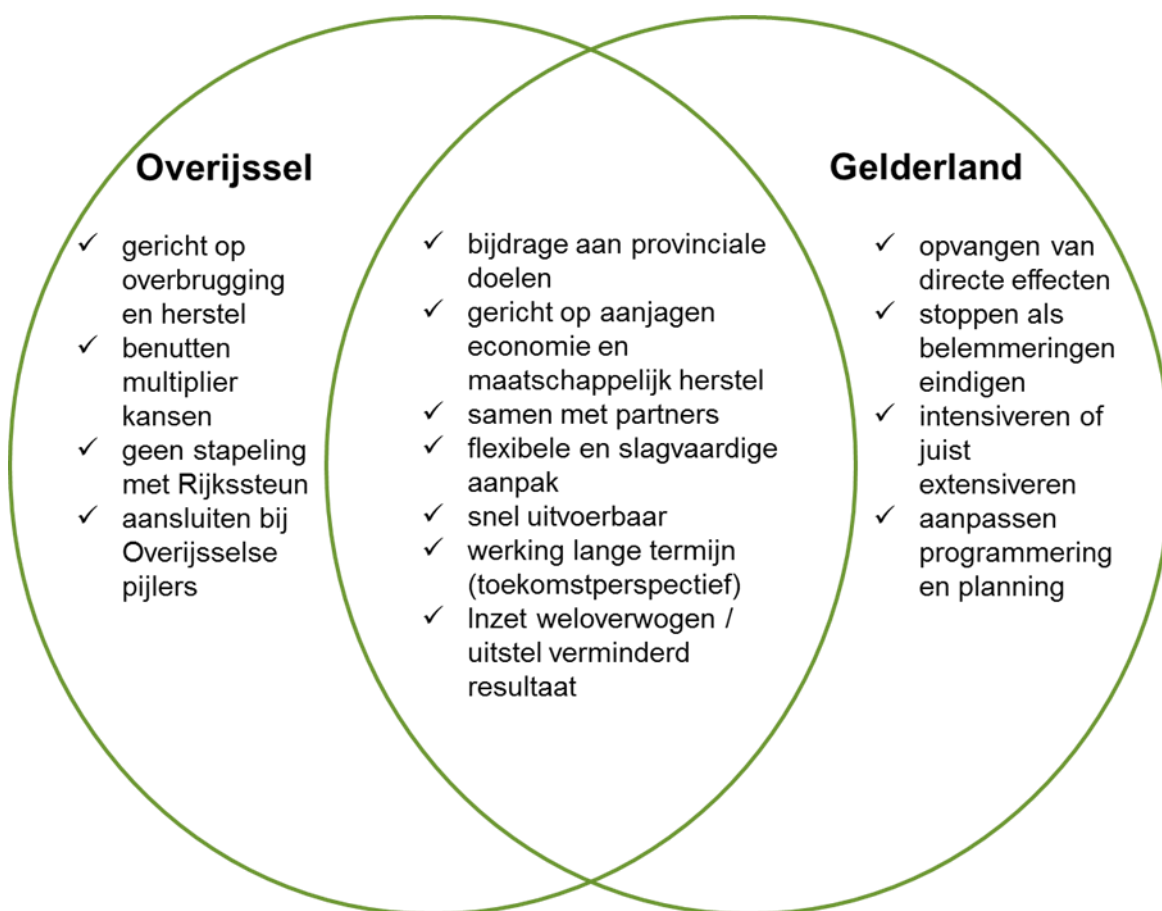
Figuur 1 Uitgangspunten en afwegingscriteria voor coronamaatregelen/projecten

In beide provincies zijn uitgangspunten voor de maatregelen geformuleerd. Uitgangspunten die voor een belangrijk deel vergelijkbaar zijn (zie figuur 1). Zo zijn provinciale doelen leidend, samen met partners en flexibiliteit belangrijk.