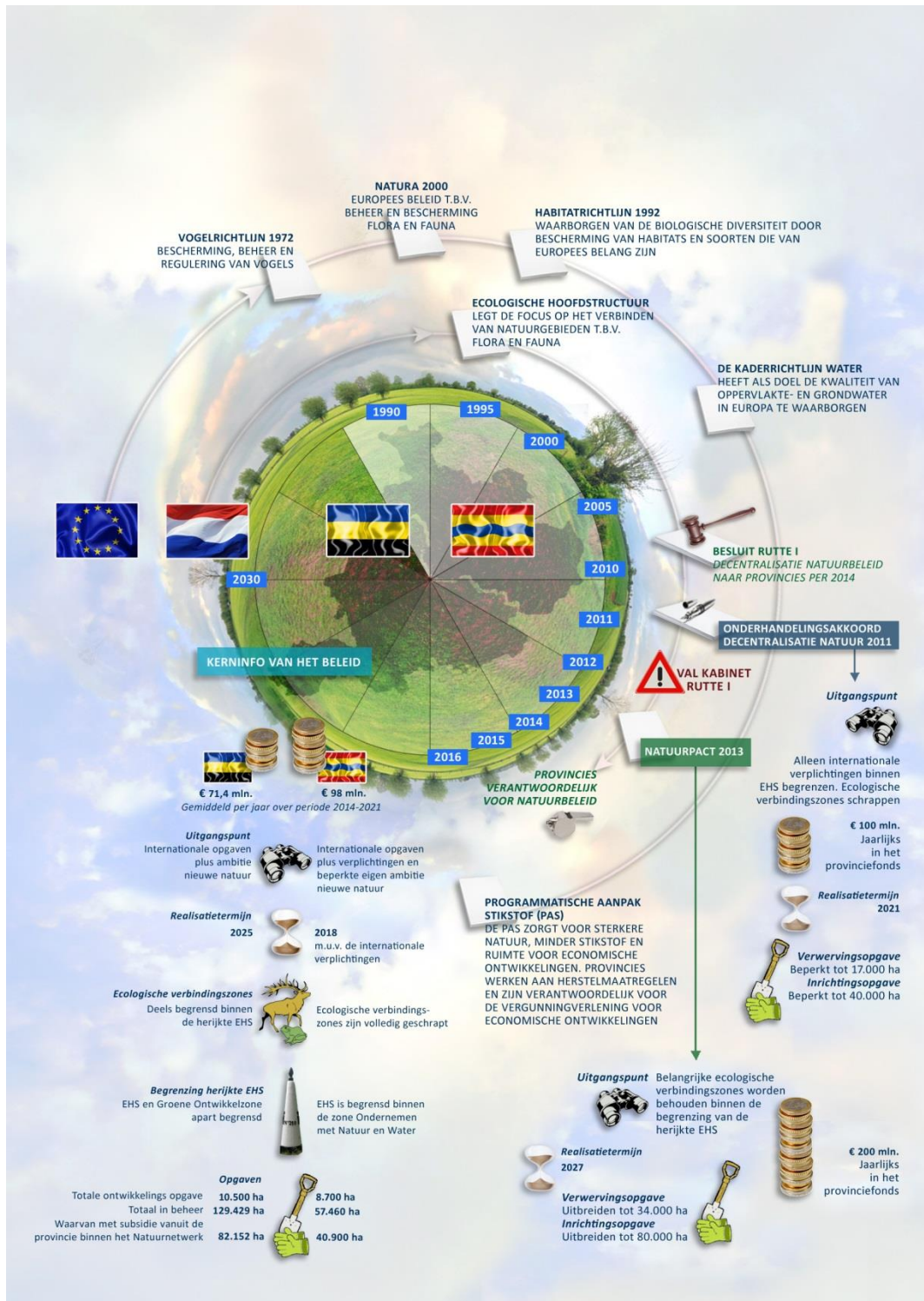
Figuur 1: samenvatting verkenning