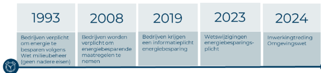
Figuur 1: Tijdlijn energiebesparingsplicht en informatieplicht energiebesparing