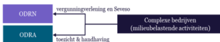
Figuur 2: Uitvoerings- en handhavingstaken omgevingsdiensten

Bron: Uitsnede van figuur 1 uit de Uitvoerings- en Handhavingsstrategie provincie Gelderland (2024)