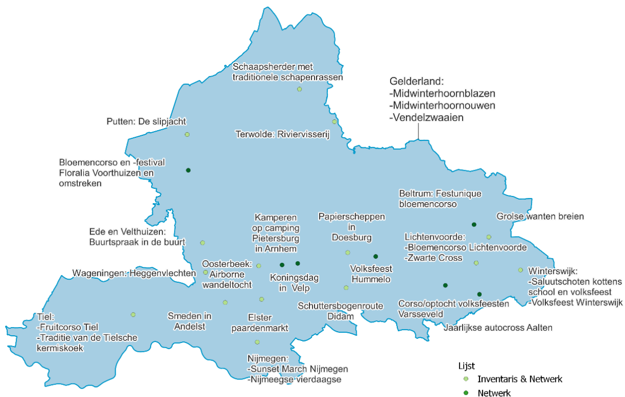
Figuur 1: Gelders immaterieel erfgoed op Netwerk en Inventaris