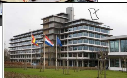
Rekenkamer Oost: veel geld dreigt te worden vergeten