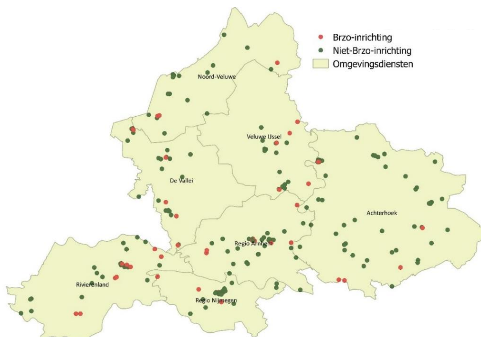
Figuur 1: Bedrijven onder bevoegd gezag van de provincie Gelderland (augustus 2019)