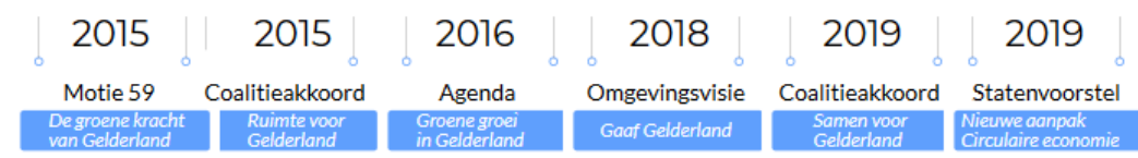
Figuur 3: Ontwikkeling beleid provincie Gelderland

PS namen in 2015 motie 59 “De groene kracht van Gelderland; een voorbeeldige overheid” aan. Daarin roepen GS op een ambitieuzere invulling te geven aan de voorbeeldrol van de provincie ten aanzien energie en duurzaamheid. In het coalitieprogramma 2015-2019 “Ruimte voor Gelderland” wordt circulaire economie als verbindend thema tussen landbouw, industrie, watermanagement en milieu genoemd.