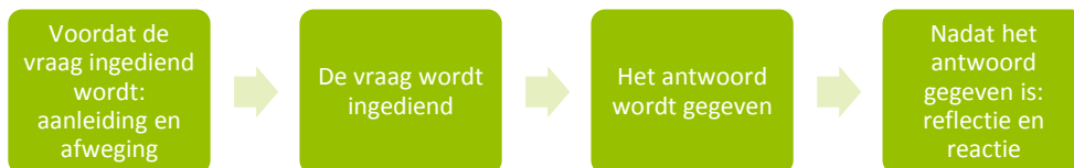
Figuur 1. Proces rondom Statenvragen