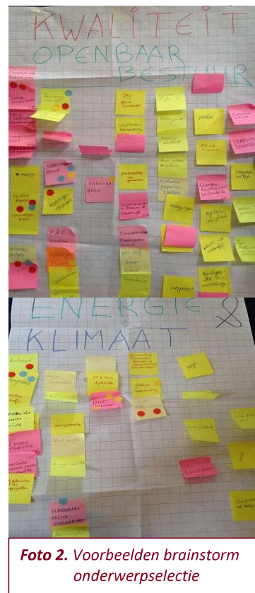
Foto 2. Voorbeelden brainstorm onderwerpselectie

Een onderwerp dat in verschillende fractie-gesprekken naar voren kwam was energietransitie. Daarom hebben we een verkenning uitgevoerd. Dit betekent dat we provinciale documenten over het energiebeleid bekeken, een oriënterend gesprek bij de provincie voerden en uitzochten of de provincie en/of anderen het energiebeleid niet onlangs hadden geëvalueerd of binnenkort zouden evalueren. Daaruit bleek dat de provincie een omvangrijk onderzoek naar energiebeleid in de planning had staan. Daarom lag een onderzoek naar duurzame energie voor de provincie Overijssel niet voor de hand. De tussenevaluatie van de provincie is juli 2013 verschenen. Waardoor een onderzoek van onze kant minder meerwaarde had gehad. Dit betekent overigens niet dat we in de toekomst dit onderwerp nooit zullen oppakken.