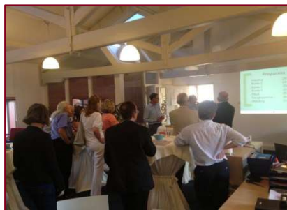
Foto 1. Inventarisatiebijeenkomst grondbeleid met Statenleden