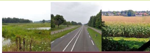
Provinciale aanpak van grondvererving in Gelderland